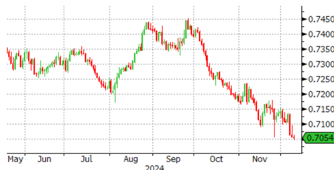
Graphique 2. CADUSD

CADUSD Currency (CAD-USD X-RATE) Candle Chart good Daily 18MAY2024-10DEC2024 Copyright © 2024 Bloomberg Finance L.P. 10-Dec-2024 16:19:40